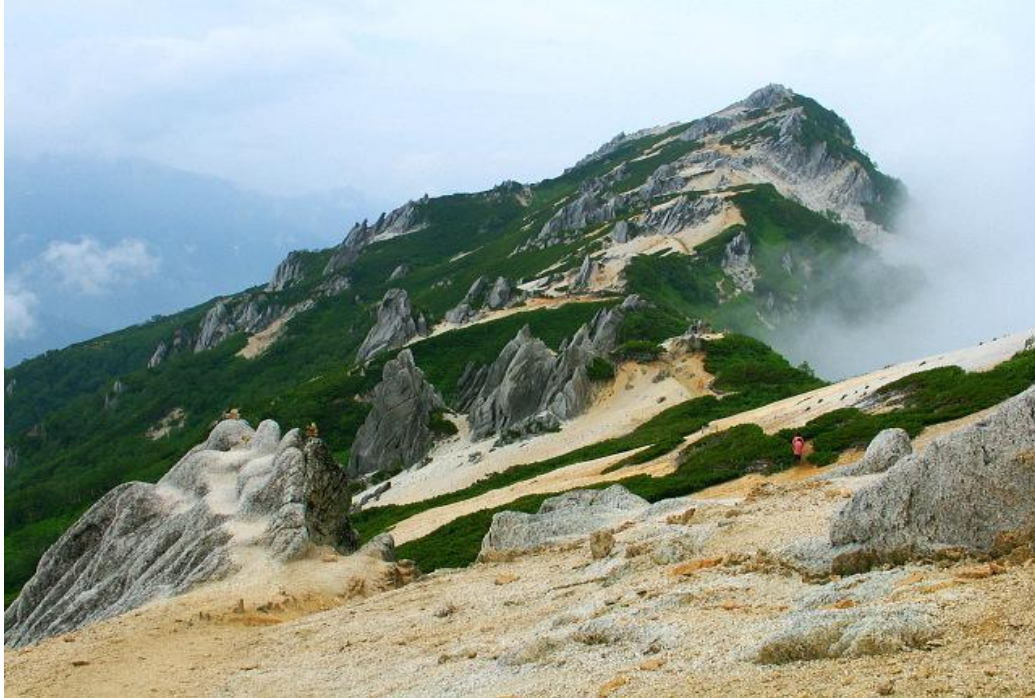
長野県大町岳陽高等学校